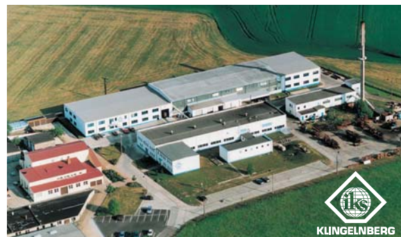
IKS Messerfabrik Geringswalde GmbH, Geringswalde

Production Mittweidaer Straße 44 D-09326 Geringswalde Germany Tel. +49 (0) 37382-846-0 Fax +49 (0) 37382-846-24 E-Mail: iksgw@interknife.com www.interknife.com