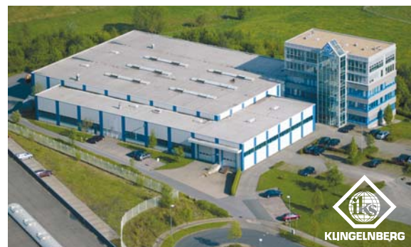
IKS Klingelberg GmbH, Remscheid

Headquarters & Sales In der Fleute 18 D-42897 Remscheid Germany T: +49 (0) 2191-969-0 F: +49 (0) 2191-969-111 E-Mail: info@interknife.com www.interknife.com