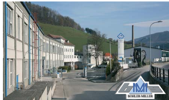
Böhler-Miller Messer u. Sägen GmbH, Böhlerwerk

Sales & Production Waidhofner Straße 11 A-3333 Böhlerwerk Austria T: +43 (0) 7442 / 601 - 0 F: +43 (0) 7442 / 601150 E-mail: info@bmms.at www.bmms.at