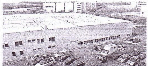
Die neue Logistikhalle aus der Vogelperspektive.

Remscheid noch mehr in den Fokus gerückt. Die neue Logistikhalle soll in Zukunft der Hauptumschlagplatz für Europa sein, und sie wird weitere Arbeitsplätze schaffen.